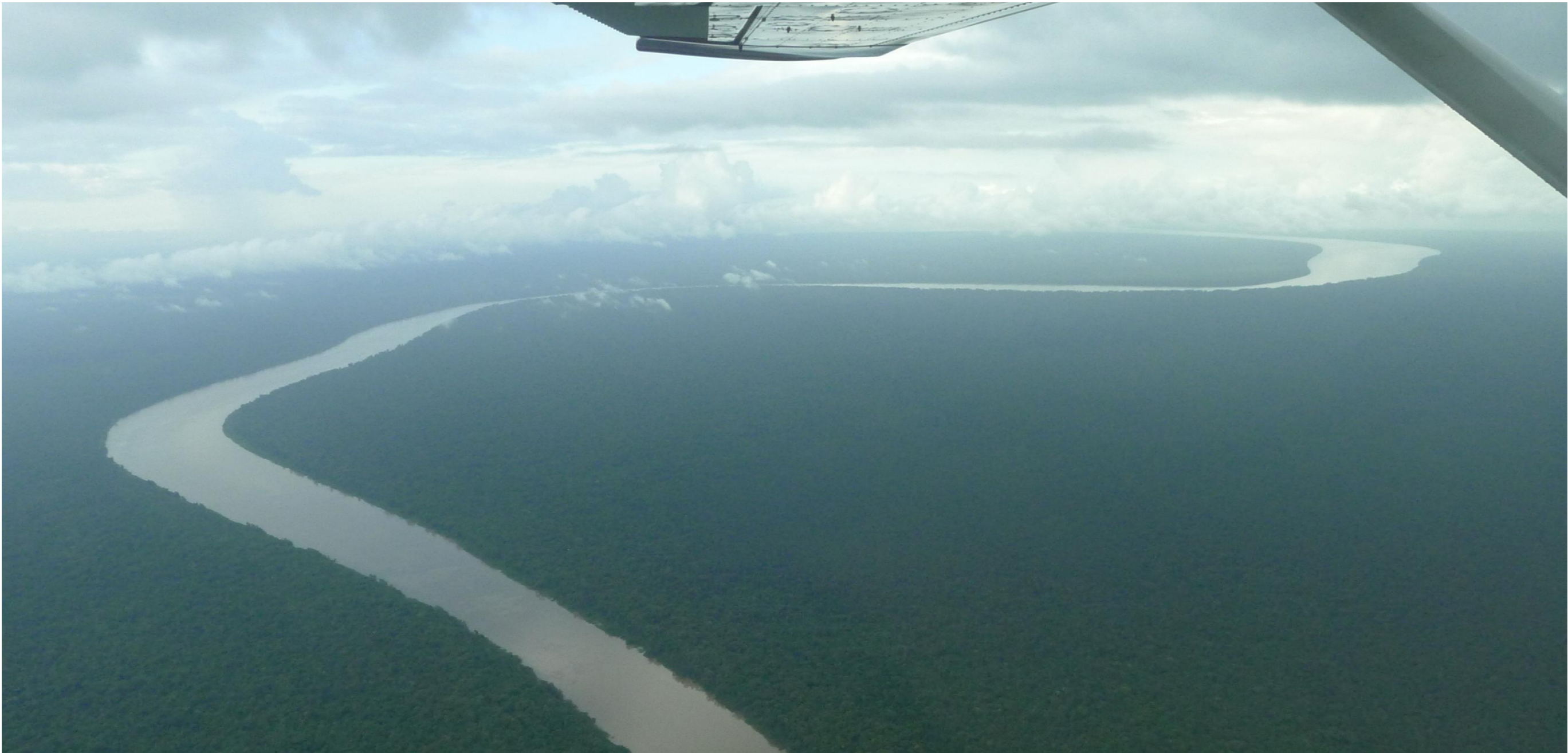
相片：鳥瞰途經綠森特許經營權的蘇利南森林