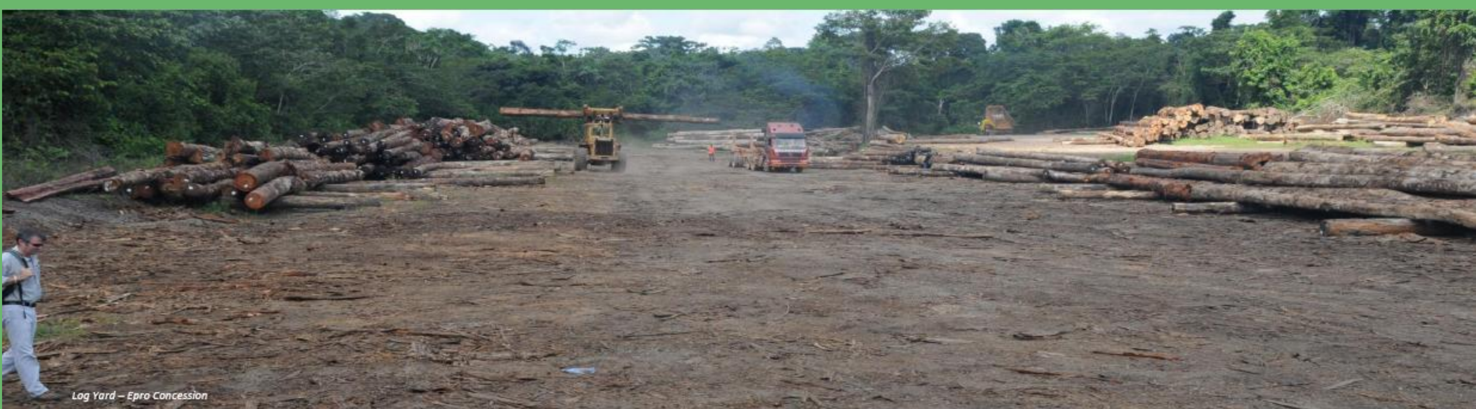
Log Yard – Epro Concession