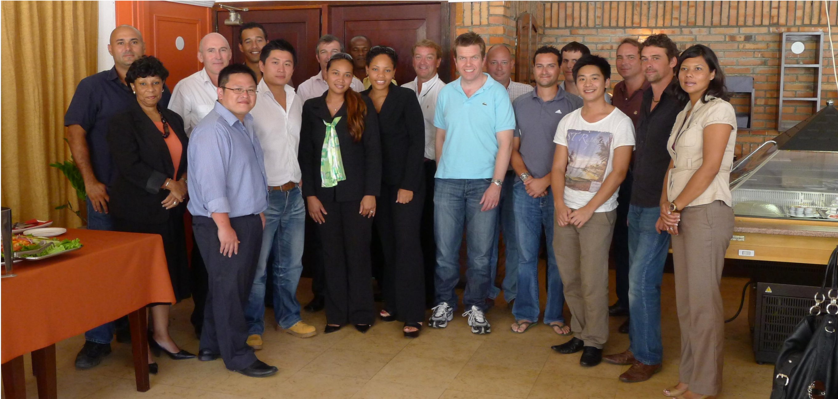
相片: 綠森集團員工及投資者