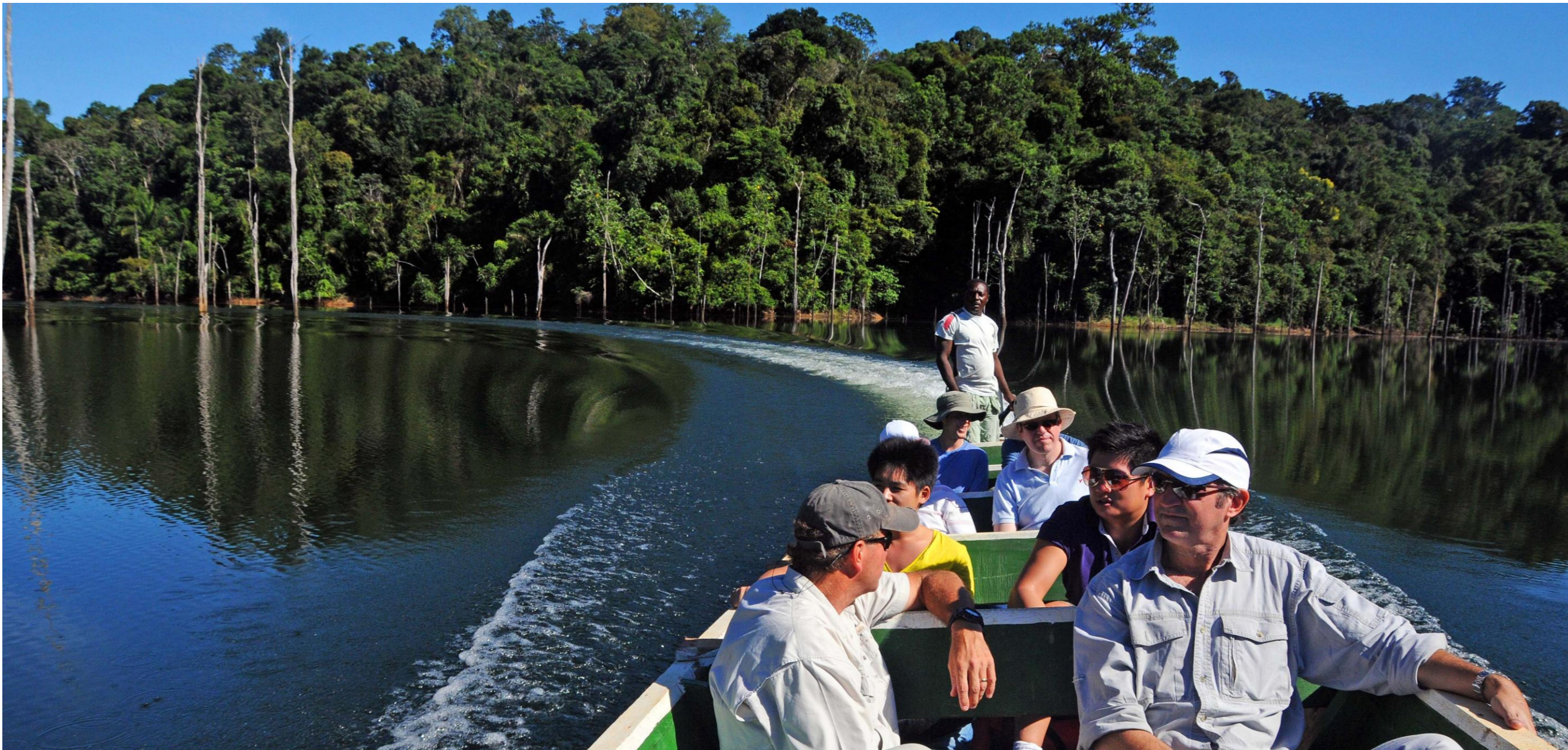
相片：綠森東部特許經營權