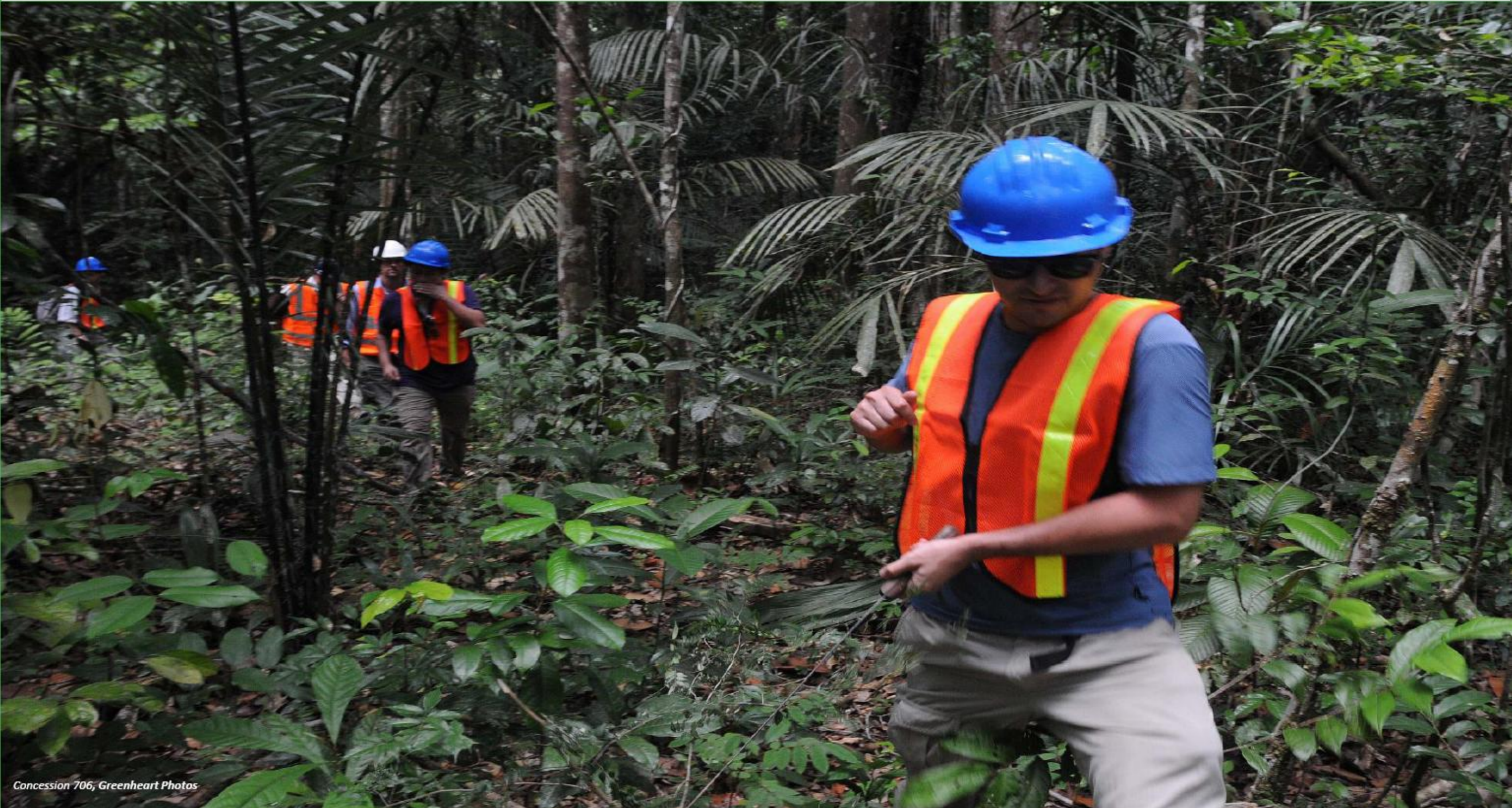
Concession 706