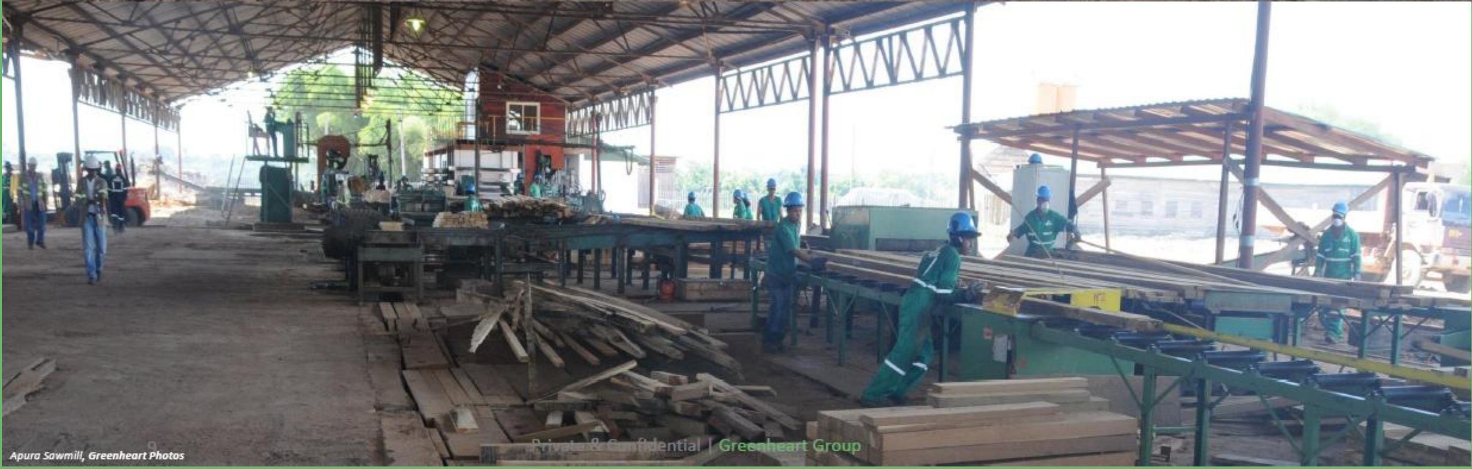
Apura Sawmill