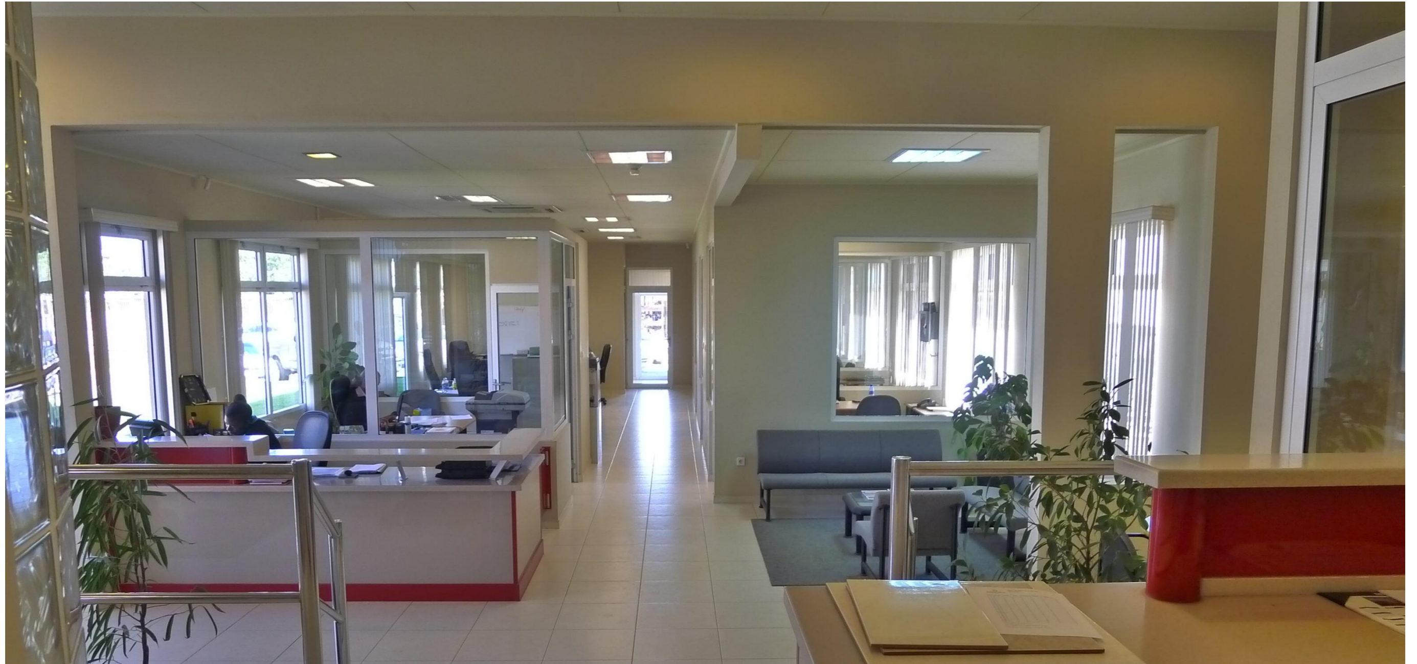
相片中: 綠森集團蘇利南總部